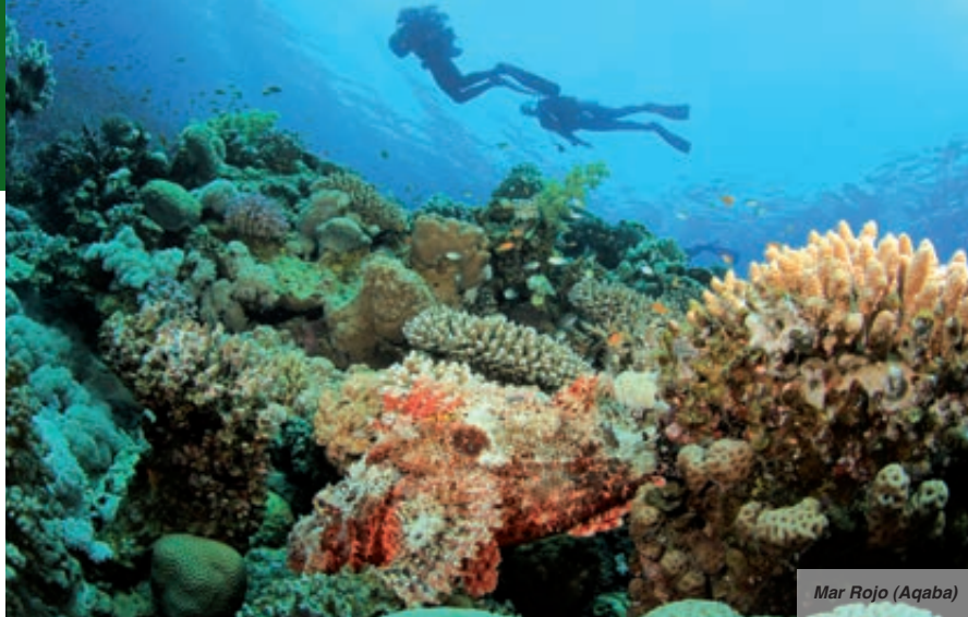
Mar Rojo (Aqaba)

simpáticos y afables, le invitarán con un té e intentarán, mediante regateo, venderles sus productos. Cena y alojamiento.