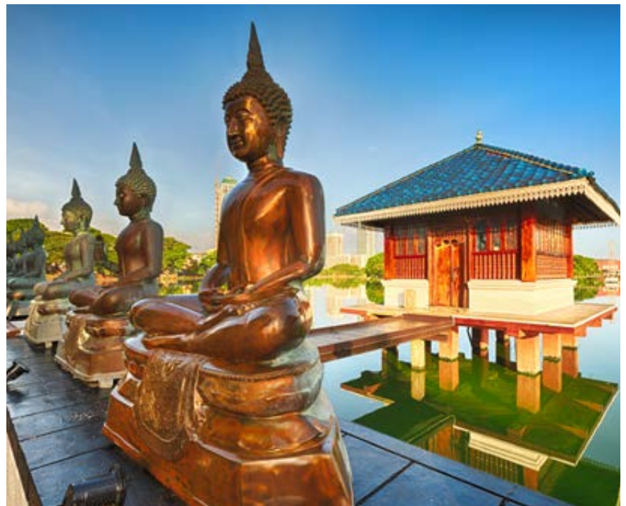
Templo Budista (Colombo)

Desayuno. Salida hacia Galle, antiguo puerto e his-