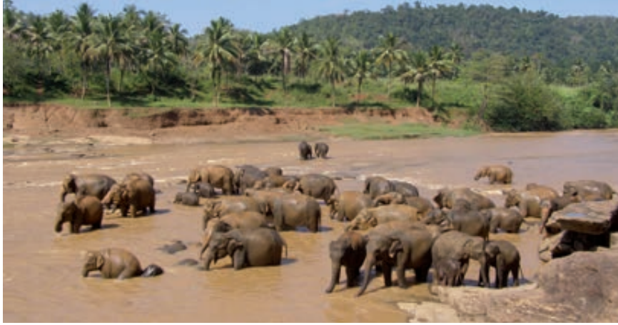
Orfanato elefantes (Pinnawala)