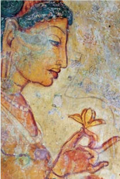
Fresco monasterio Sigiriya