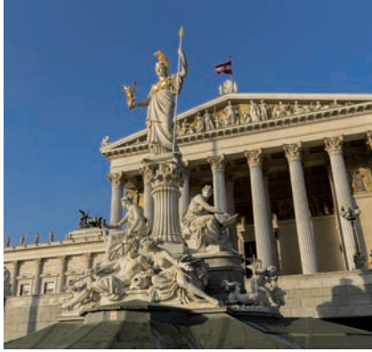
Parlamento de Viena