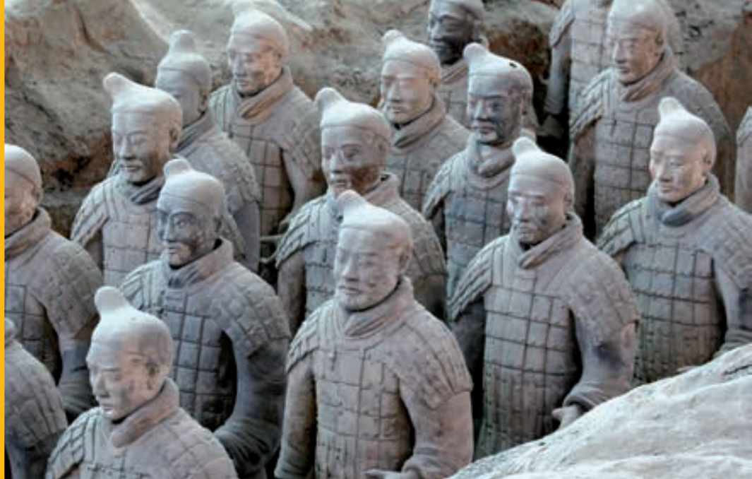
Guerreros y Corceles de Terracota. XI'AN.