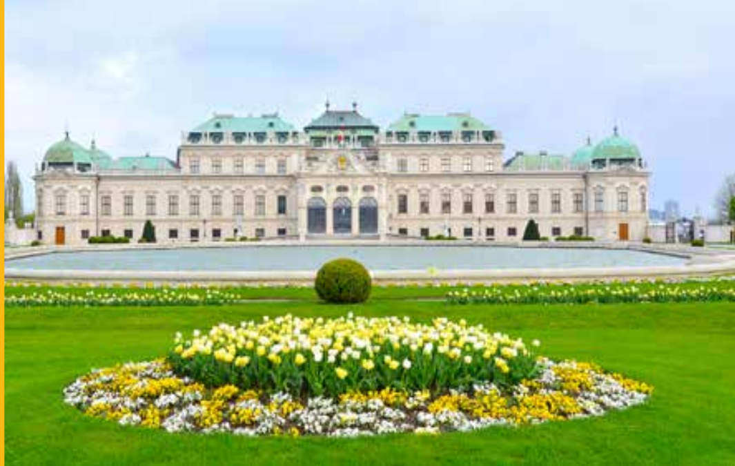
Palacio de Belvedere. AUSTRIA