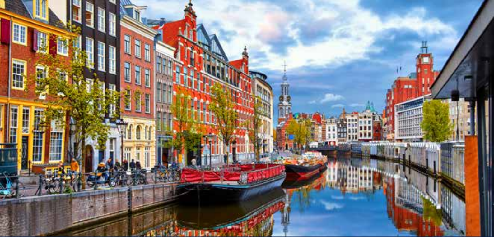
Canales de Ámsterdam.