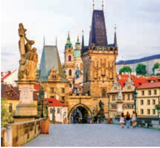
Ponte de Carlos (Praga)