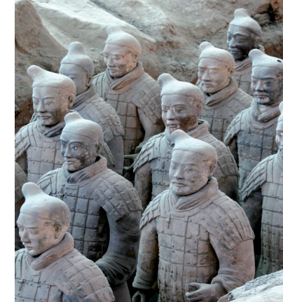
Guerreiros de terracota (Xian)