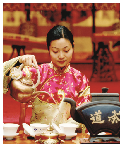
Cerimônia do Chá