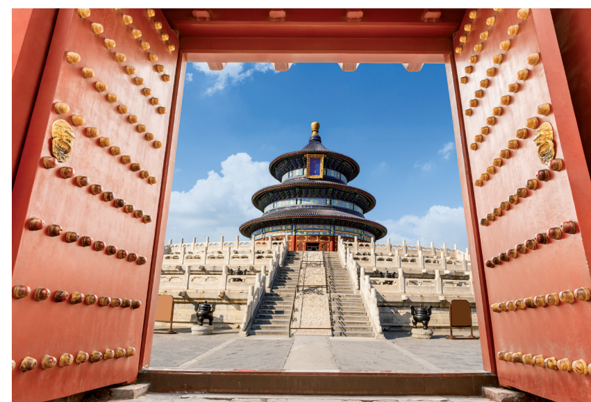
Templo do Céu