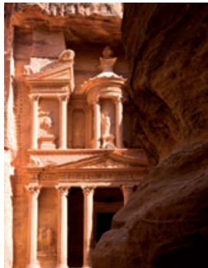
El Tesoro (Petra)

Café da manhã. No horário indicado, traslado ao aeroporto. Fim da viagem e nossos serviços.