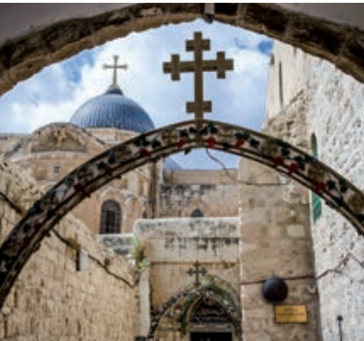
Santo Sepulcro (Jerusalém)