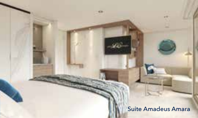
Suite Amadeus Amara