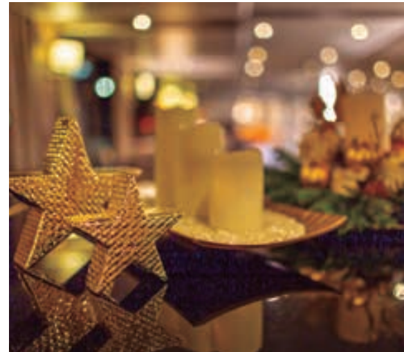
Ambiente navideño a bordo.