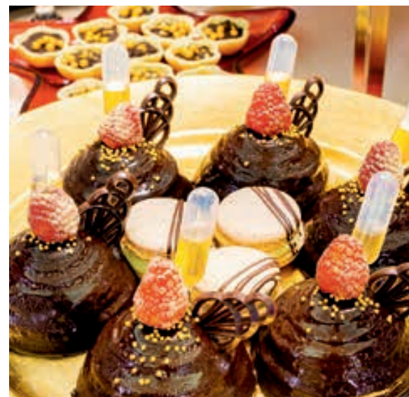
Delicias después de la cena.