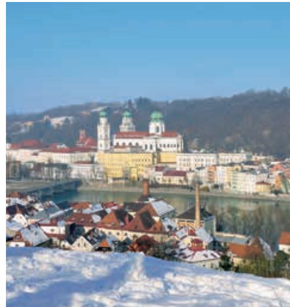
Paisaje navideño de Passau.