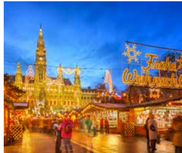
Viena: mercadillo de Navidad.